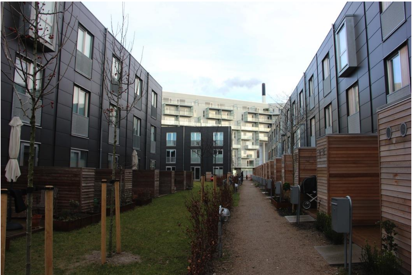
Tæt ved Udsigten, som ses i baggrunden, har Sjælsø Management også opført rækkehusprojektet Byhusene, som også er tegnet af tegnestuen Vandkunsten.