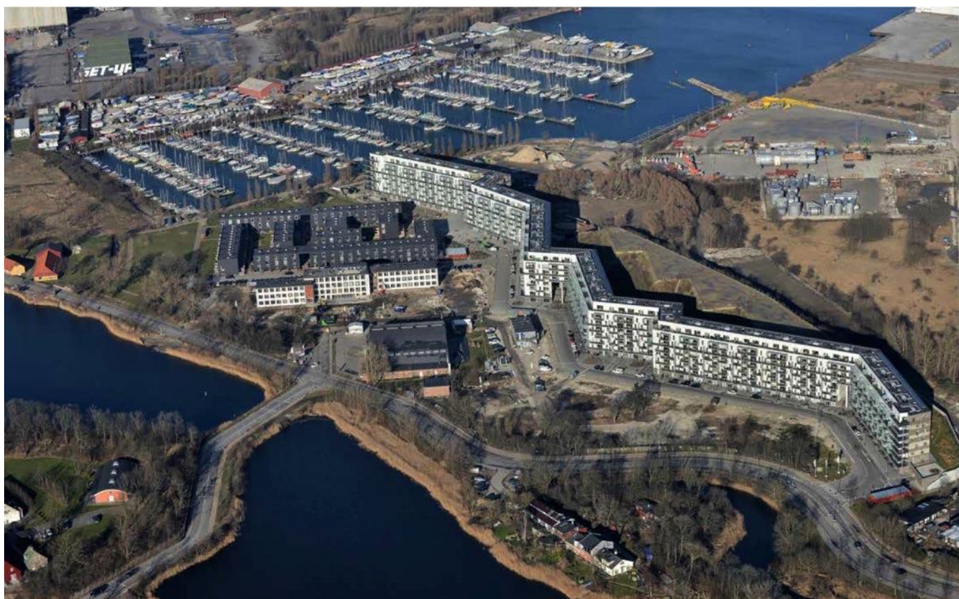
Margretheholm luftfoto; marts 2015

Byens Netværk besøger Margretheholm, hvor vi hører om boligbyggeriet Udsigten og ser bl.a. den smukke udsigt over København, som har givet navn til boligbyggeriet.