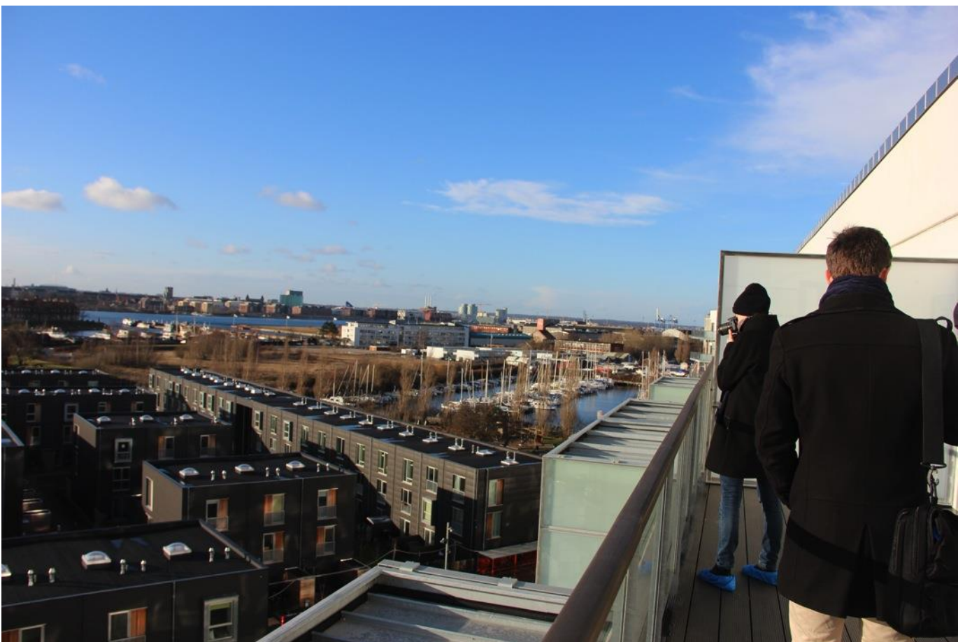
Den smukke udsigt over København fra terrassen til en penthouselejlighed på 8. etage. På den modsatte side af byggeriet er der udsigt over lystbådehavnen Lynetten.