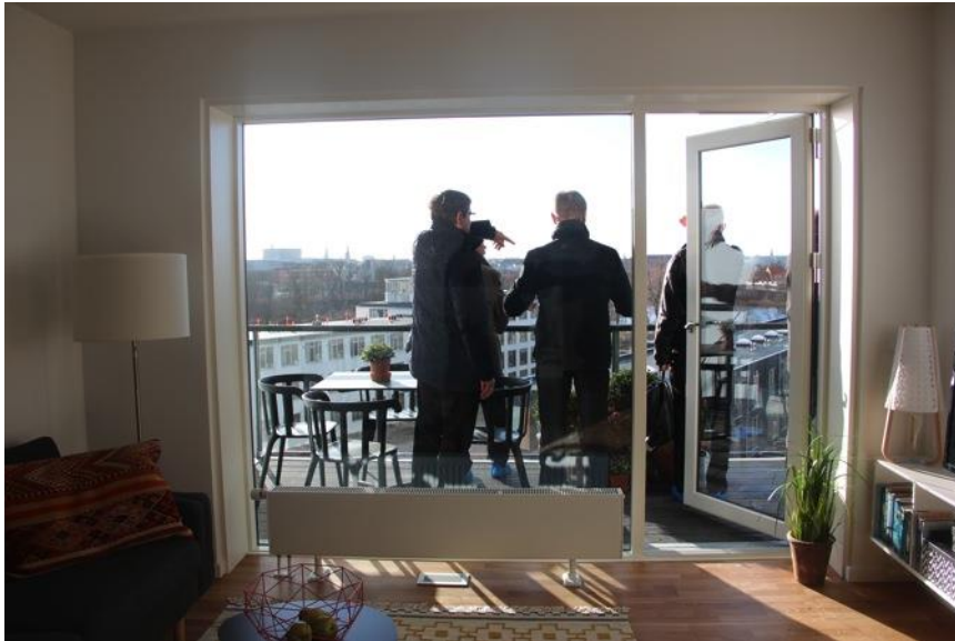
Lejlighedsfremvisning i en 3 værelses lejlighed på 5. Etage.