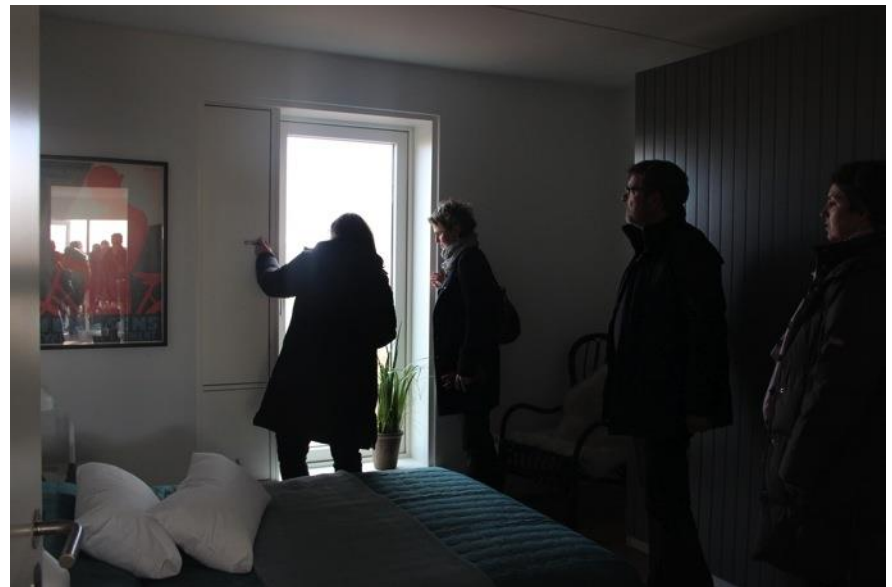
Her afprøves hængslede skodder med lydafsærmende funktion, som er monteret på den østlige side af byggeriet.