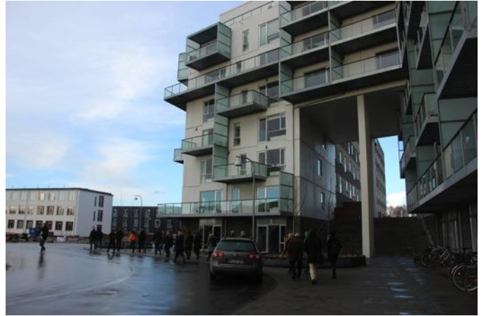
Der er lavet porte igennem byggeriet, som giver adgang til et hævet udeareal på den anden side.