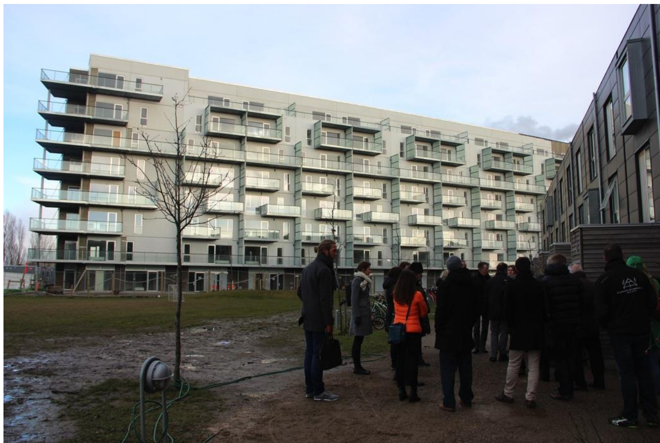
Lige nu afsluttes de sidste to etaper af byggeriet, hvor det forventes at de kommende beboer kan flytte ind til april/juni.