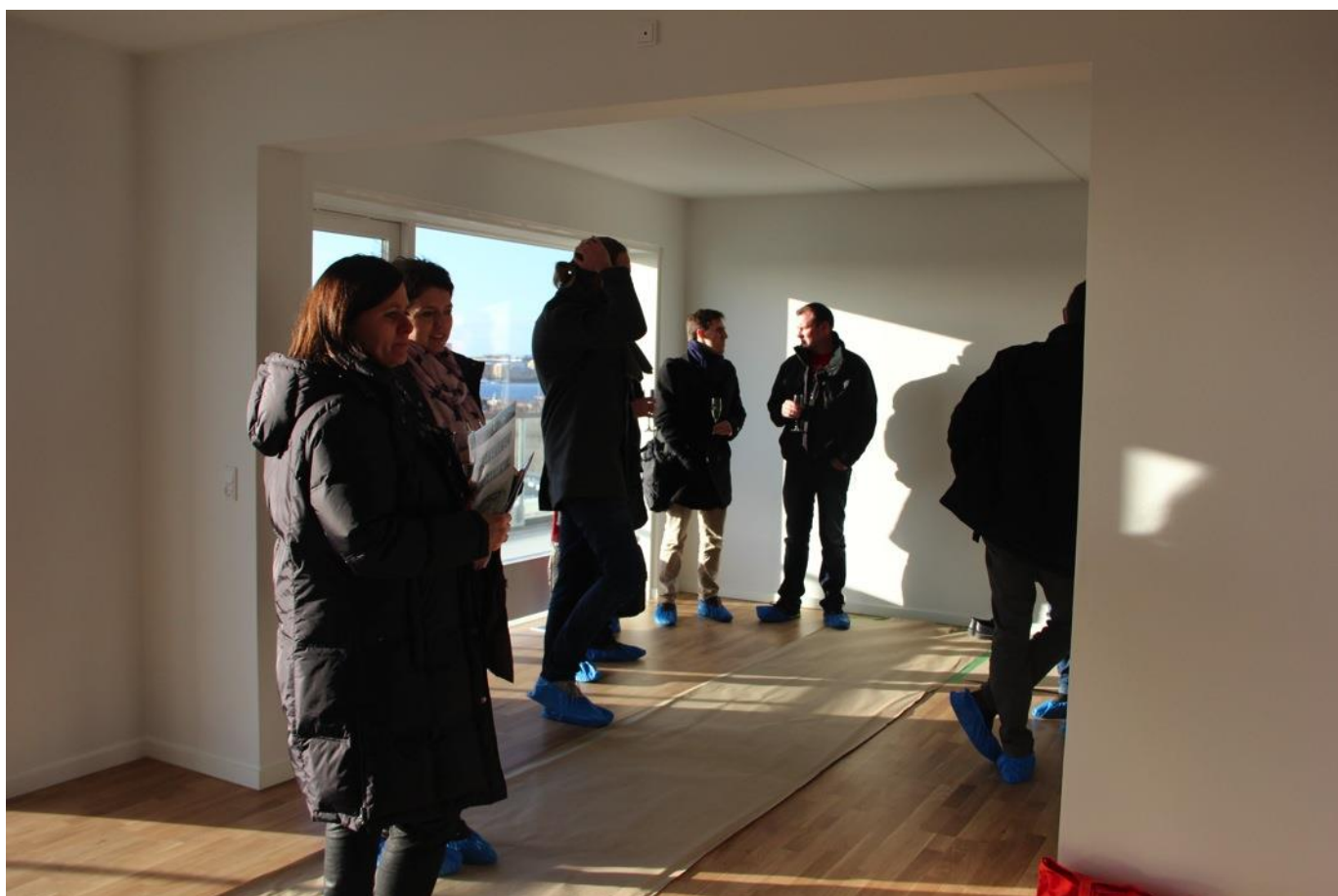
Eftermiddagen afslutter vi med hyggeligt networking og med en dejlig solrig udsigt over København.