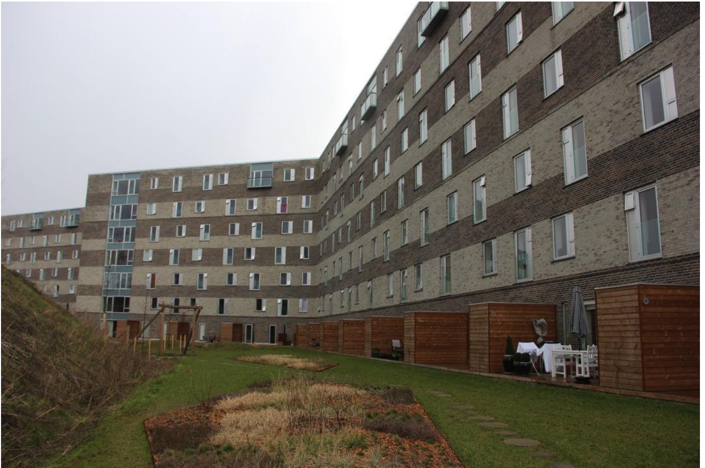
Udsigten er 550 m langt, 8 etager højt og rummer ca. 465 boliger.